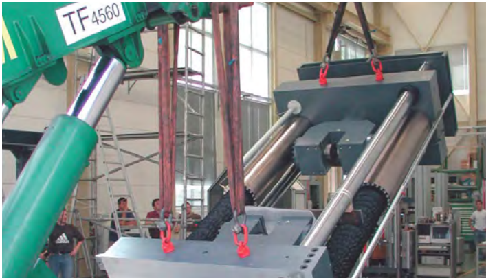
Professioneel transporteren en verhuizen