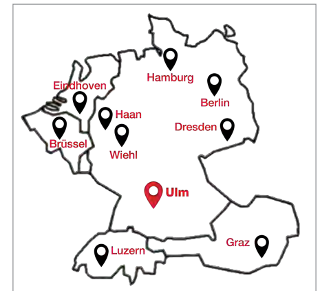
Opleidingen bij klanten op locatie