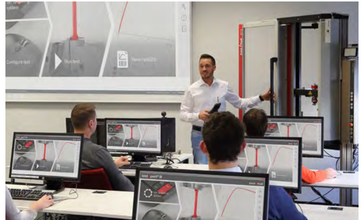
Optimale leeromgeving dankzij kleine opleidingsgroepen