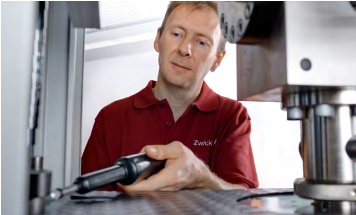
IJkingswerkzaamheden in het kader van de kalibratie