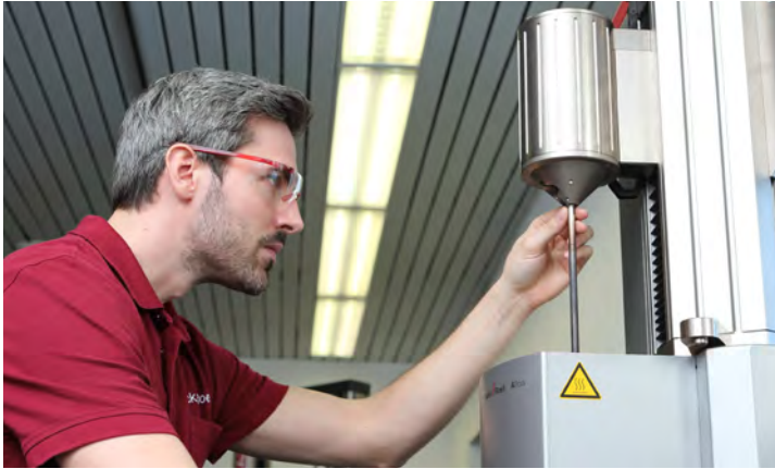
Uitgebreid aanbod aan kalibratieservices