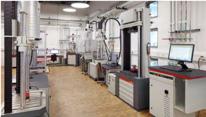
Testlaboratorium voor dynamische vermoeidheidsproeven