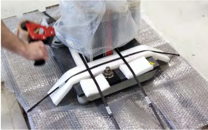
Professionele voorbereiding op het transport