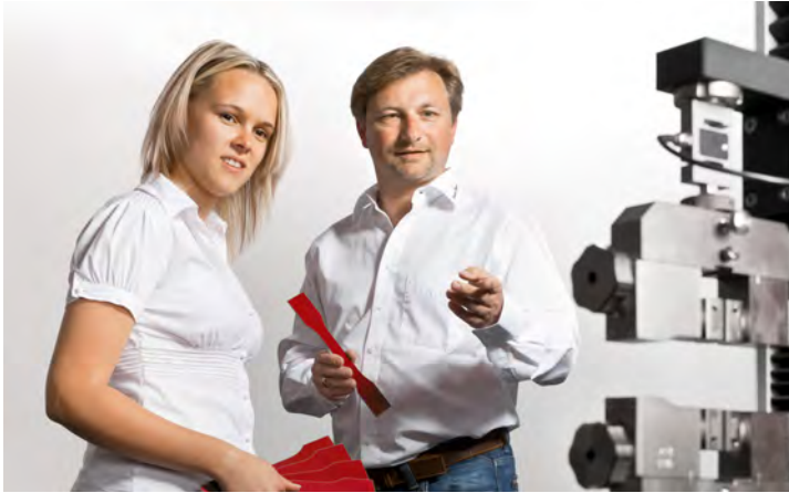
Advisering over beproevingsmethodes en proefruns