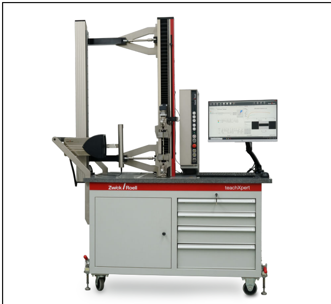
teachXpert (Abbildung ähnlich)