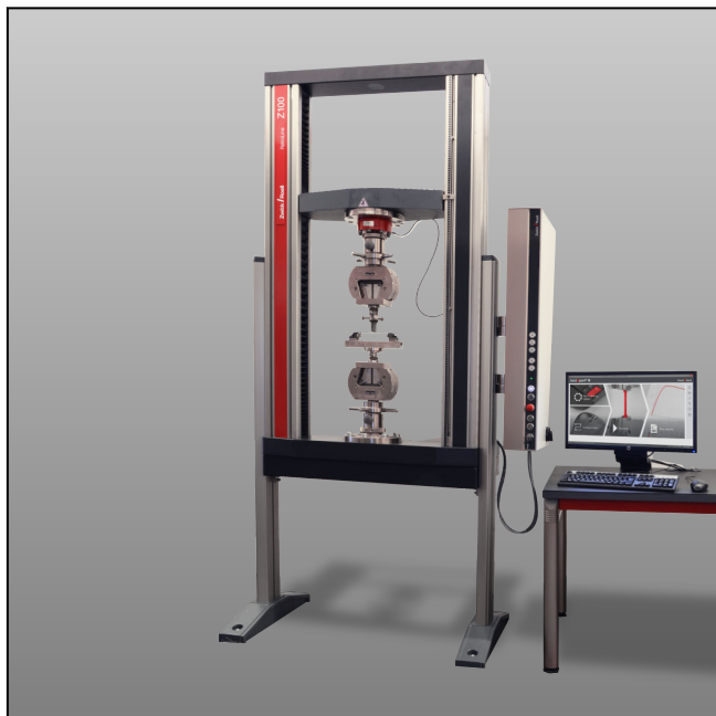
ZwickRoell Z100 mit testControl II modernisiert