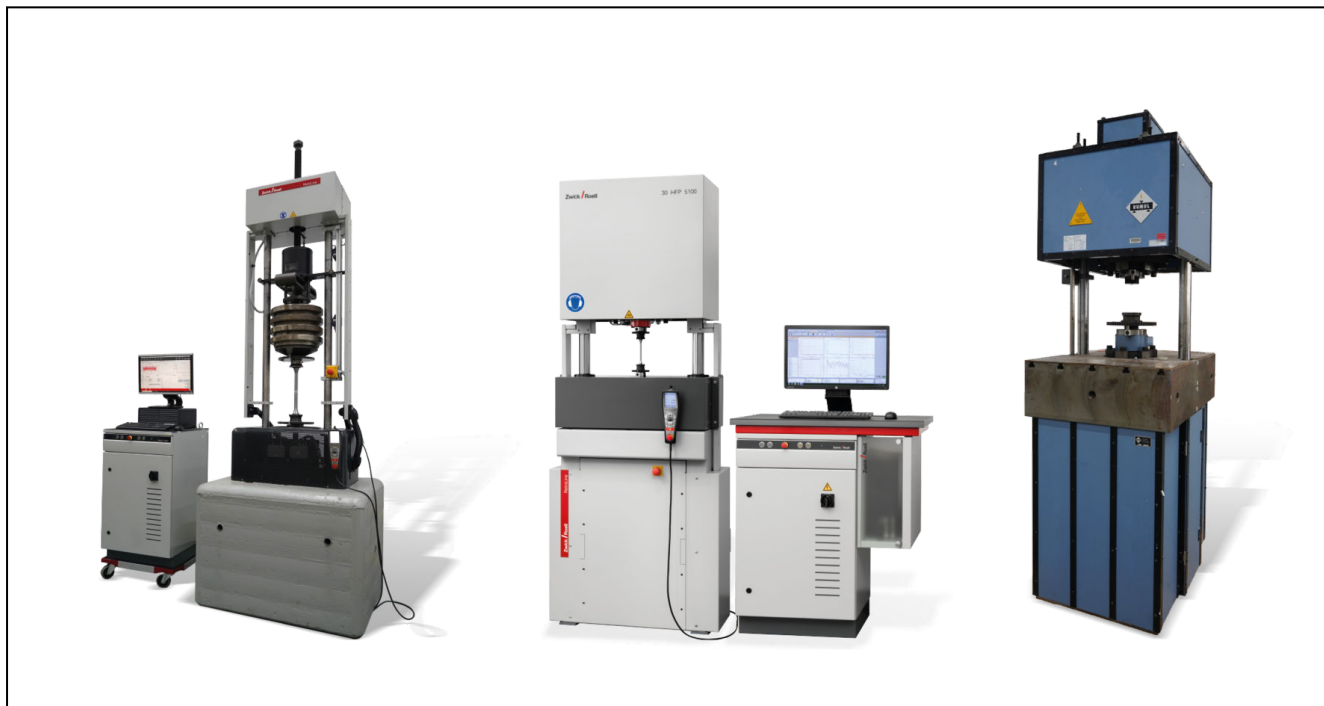
Herstellerunabhängige Modernisierung von Hochfrequenzpulsatoren