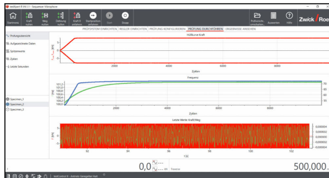
testXpert R Prüfvorschrift Einstufen-Dauerschwingversuch

weise der Dauerschwingversuch nach DIN 50100 (Wöhlerkurve) im Zug-, Druck-, Schwell- und Wechsellastbereich besonders bedienerfreundlich umgesetzt werden. Die Aufbringung der Prüfkraft erfolgt in nacheinander ablaufenden Prüfabschnitten. Dabei wird zuerst die Vorlast (Mittelkraft), anschließend eine Anfangskraftamplitude und letztlich die gewünschte Prüfkraftamplitude aufgebracht.