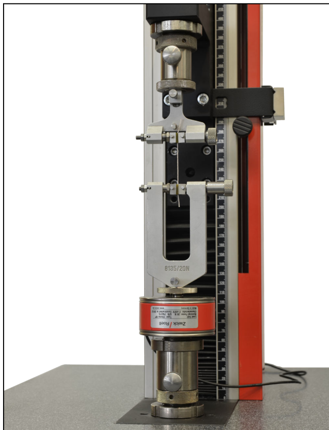
Federschraub-Probenhalter Typ 8135, Fmax 20 N