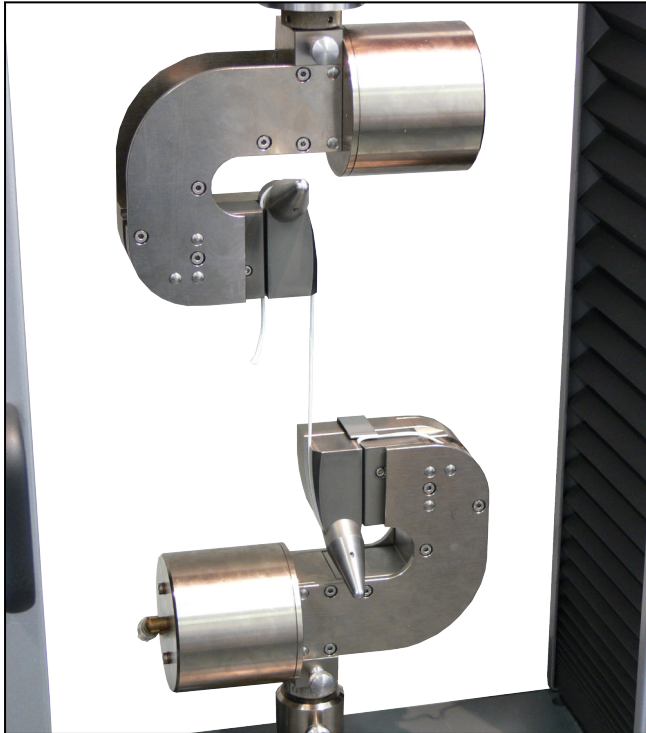
Umlenk-Probenhalter für hochfeste Kunststoffgarne Typ 8297, Fmax 2,5 kN