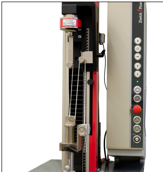
Doppel-Umlenk-Probenhalter Typ 8170, Fmax 500 N