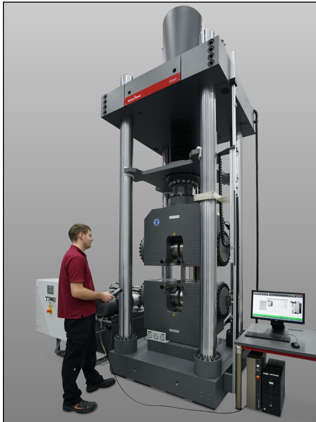
ZwickRoell Z3000H mit Hydraulik-Probenhalter