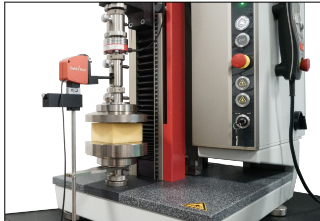
ZwickRoell Wegaufnehmer mit Druckprüfung