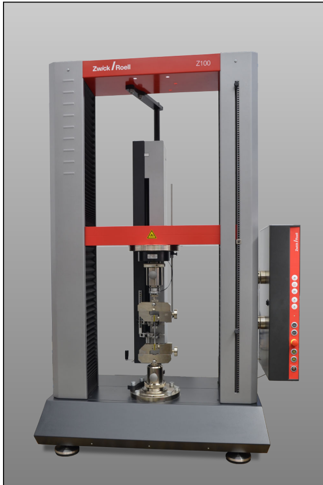
Langweg-Extensometer speziell für ProLine-Prüfsysteme