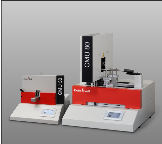
Stand-alone Querschnittsmessgeräte CMU30 und CMU80