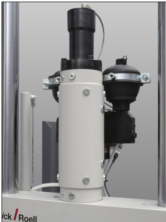
LH-Zylinder, Überkopfmontage in einem Prüfraum