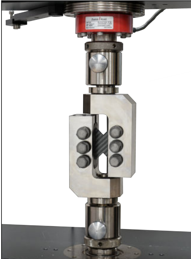
Schervorrichtung nach ASTM D 7078