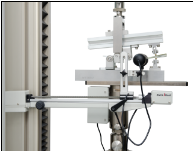
Mixed Mode Biegevorrichtung mit Option Video Recording