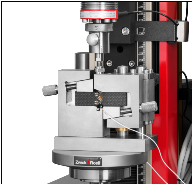
V-Notched Beam (Iosipescu)-Schervorrichtung