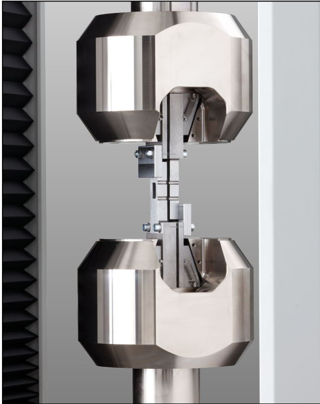
Open Hole Compression-Vorrichtung, Krafteinleitung über Probenhalter