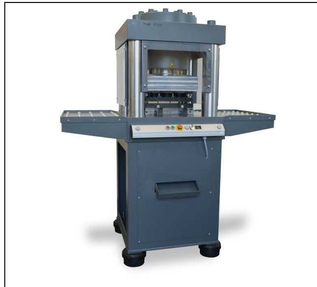
Hydraulische Probenstanze RZ 100

Die offene Form von Probenstanze und Stanzwerkzeug (C-Form) erlaubt die Probenentnahme auch aus Tafeln. Werden mehrere Stanzwerkzeuge verwendet, empfiehlt sich die Tischverbreiterung (Optionen), ausgeführt als Rollentisch, damit die gerade nicht benötigten Stanzwerkzeuge abgelegt werden können. Der Werkzeugwechsel dauert mit Tischverbreiterung ca. 20 Sekunden. Somit erzielt man bei häufigem Werkzeugwechsel deutliche Zeiteinsparungen. Die Probenstanze M-Cut 65 (für 650 kN Druckkraft) ist für Materialdicken von 0,04 ... 6 mm geeignet (abhängig von der Zugfestigkeit und der Probenform).