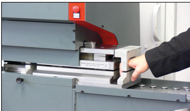
Schneller Wechsel der Stanzwerkzeuge durch die Tischverbreiterung zum M-Cut 65