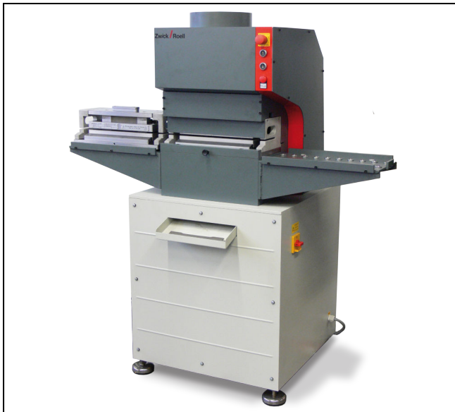
Hydraulische Probenstanze Typ M-Cut 65 mit Option Tischverbreiterung