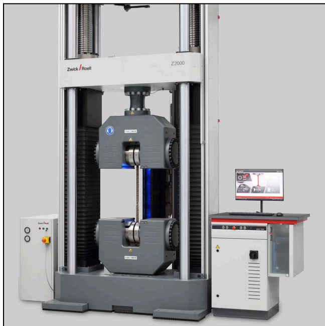
videoXtens 6-680 HP an Z2000E